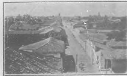
Calle de la República

Sin embargo, no cerraré este capítulo de impresiones camagüeyanas sin antes hacer constar que posee Camagüey un Casino campestre, verdadero parque, que ya quisiera tener la Habana. La luz eléctrica ha reemplazado en casi toda la ciudad al antiguo farol de petróleo colgado del