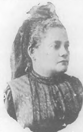
María Grajales Vda. de Maceo