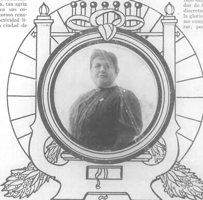
LOLA RODRIGUEZ DE TIÓ Nuestre poetisa puertorriqueña, gloria de Cuba.