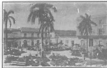
Parque de Agramonte

La ciudad de las iglesias la llamaría yo por el número exorbitante de las mismas que se cuentan. Sobran la mitad, más la mitad de la otra mitad. Con la cuarta parte de las que tiene, le bastaría. Habría menos fanatismo religioso.