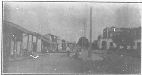
Avenida de la Libertad

La virginidad de la vida camagüeyana quedó por siempre deshecha. Ayer, antes de ese ferrocarril civilizador, no había mujer burlada por galán audáz, porque el respeto era la ley patriarcal, y la honra de la familia se lavaba en casa. Hoy, la invasión de las aves de paso ha traído vicios y gangrenas que toman cuerpo, y es que han encontrado terreno virgen, a propósito para florecer con exuberancia. El galán protervo, engaña y huye, dejando abandonado el nido de amores, y la desazón en la familia. Esto que he conjeturado, me lo refiere un camagüeyano observador de las bienaventuranzas y de los males que el ferrocarril ha traído a Camagüey. "Aquí se vivía en familia; casi todos los camagüeyanos estábamos emparentados; el que pretendía a una dama, la llevaba ante el altar; esa era el paso previo para poscerla, hoy, todo ha variado, amigo mío,—me decía:—la gente forastera, que