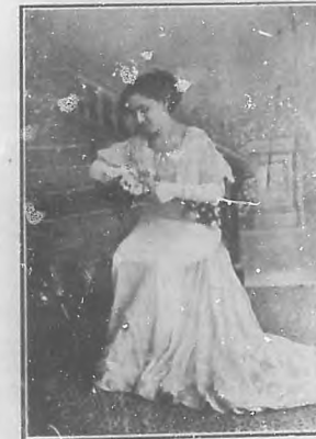
OSTA MARIA DE LA ODRÁ

Las personas que deseen localidades pue-