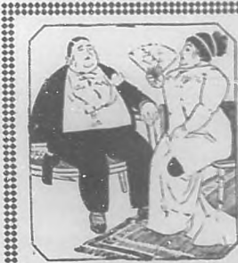
La gordura es peligrosa y nociva

Procedimientos prácticos en la enseñanza mercantil — Cálculos peritos-cuentas á todos los giro — Idiomas — Taquígrafía. — Matemáticas. Se admiten internos. — Damos el título de Tenedor de Libros. — Pídanse prospectos.